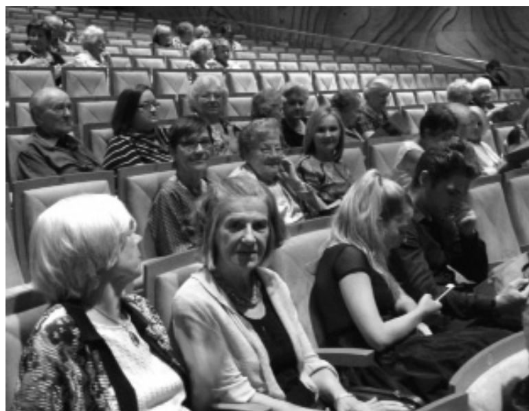
Pazīstama dziedātāja un pazīstama publika.