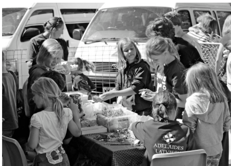
2015. gada 21. martā bērnu dārza zālājā notika Adelaides Latviešu skolas olu krāsošana, gatavojoties uz Liieldienām. Bērnu dārznieki, kopā ar saviem vecākiem, satina baltas olas zēku biksēs kopā ar sarkanām un brūnām sīpolu mizām, kā arī izmantoja dažādas sēklas, lai iegūtu spilgtāku un kontrastaināku olu krāsu.

Braucot uz pilsētas centru, pārbraucam pāri 'Gulbju upei' un tad jau turpat ir arī mūsu viesnīca. Tā kā tikai tik vien tā laika ir kā šovakar, jo jau no rīta vēstnieks atkal brauc uz ciemiem pie mūsu kaimiņiem Adelaidē. Aizbraucam uz viesnīcu, pierakstāmies, sanesam savus nesamos istabās un nu bez nekādas lielas kavēšanās braucam atkal. Taču viesim ir jāparāda arī kaut kas drusku no Pertas. Uzbraucam lielajā piepilsētas kalnā 'Kēniņa parkā', kur Perta ir kā uz delnas. Nu taču nemaz tik maziņa tomēr nav. Nu jā, Rietumaustrālijā ir tikpat daudz cilvēku kā visā Latvijā, 2,5 miljoni, un no tiem (Turpinājums 7. lpp.)