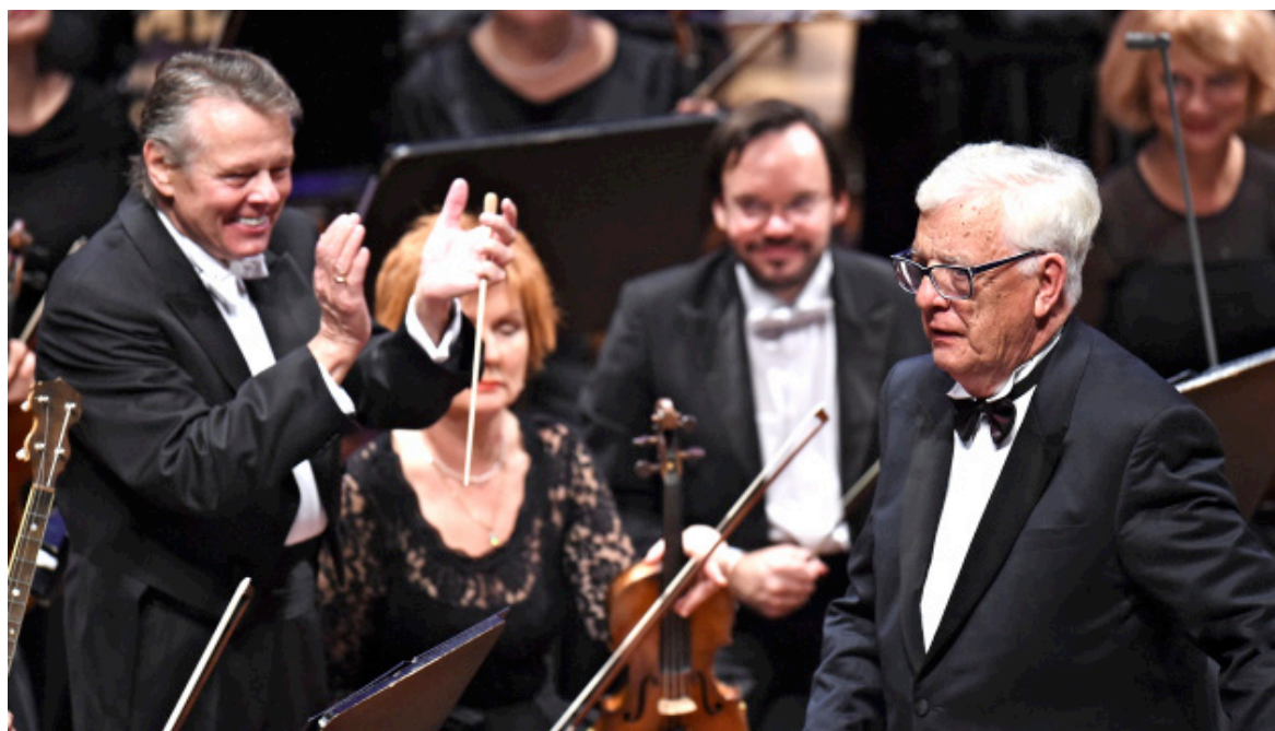
Diriģents Mariss Jansons (no kreisās) un komponists Raimonds Pauls uzstājas Latvijas Nacionālā simfoniskā orķestra 90. jubilejas atklāšanas koncertā Lielajā ģildē.

Lielajā ģildē 16. septembrī notika Latvijas Nacionālā simfoniskā orķestra (LNSO) jaunās sezonas atklāšanas koncerts, kuru vadīja pasaulslavenais diriģents Mariss Jansons. (Turpinājums 8. lpp.)