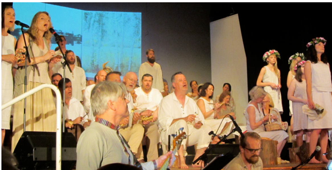
"Pagānu gadagrāmatas" pašmāju talanti.