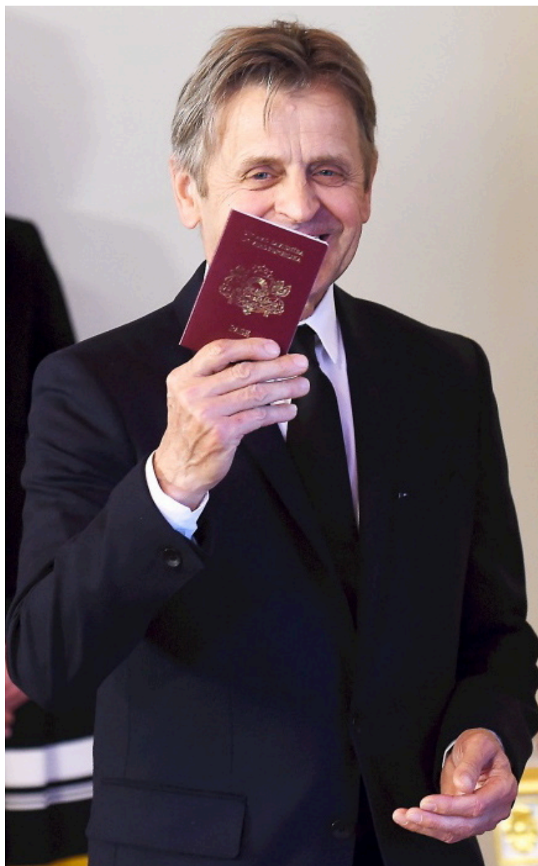
Jaunais Latvijas pilsonis Mihails Borišņikovs.

Latvijas pilsonībā uzņemtais, Rīgā dzimušais pasaulslavenais baletdejojājs Mihails Barišņikovs, saņemot pasi, sirsnīgu uzrunu nolasīja latviešu valodā, kurā, kā viņš pats atzina, nebija runājis vairāk nekā 50 gadus. Viņš sacīja, ka ir lieliski atgriezies bērnības zemē ne kā svešiniekam, bet kā savējam.