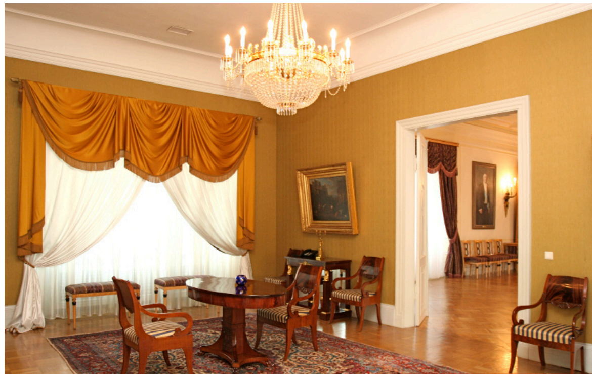
Zelta zāle. Nosaukums saglabājies no pirmskara laika. Telpai ir īpaša nozīme kā augstākā ranga personu pieņemšanas salonam. Te ir greznas tapetes zelta krāsā, pie sienām P. Veronēzes gleznas "Triju ķēniņu pielūgšana" (19. gs. sākuma kopija) un divas holandiešu meistara P. van Blūmena (17. gs.) gleznas - "Pilsētas laukums" un "Apmetne pie strūklakas". Apgaismojumam lustra, kuru pēc 19. gadsimta sākuma parauga izgatavoja Austrijas firma "E. Bakalowitzs Söhne".

Transporta organizācijai rīdniekiem solīja "pagriezt" (Turpinājums 8. lpp.)