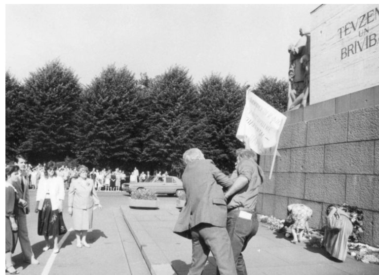
Pirms 30 gadiem - 1987. gada 23. augustā pirmo reizi visā Baltijā masveidīgi pieminēja 1939. gada Molotova-Ribentropa pakta gadskārtu. Pie Brīvības pieminekļa tajā datumā notika protesta demonstrācija pret padomju okupācijas režīmu.

Šajā politiski neskaidrajā un bīstamajā laikā Latvijas Republikas Augstākās padomes deputāti spēja sapulcēties uz sēdi, sagatavot un pieņemt Konstitucionālo likumu. 1991. gada 21. augusta sēdē debates par Konstitucionālā likuma tekstu pārtrauca paziņojums, ka mūsu Augstākajai padomei tuvojās OMON bruņutransportieri. Šādos apstākļos Augstākās padomes deputāti turpināja apspriest Konstitucionālā likuma tekstu un nobalsoja par tā pieņemšanu.