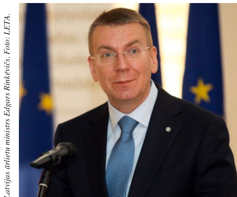
Latvijas ārlietu ministrs Edgars Rinkēvičs.

vienlaikus atgādinot, ka lielākā daļa pasaules valstu, tajā skaitā Francija to uzskatīja par pretlikumīgu un neatzina, kas nodrošināja Baltijas valstu valstiskuma kontinuitāti pēc Padomju Savienības sabrukuma un neatkarības atgūšanas.